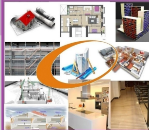
REDACCIÓN DE PROYECTOS DE EDIFICACIÓN