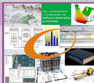
COLABORACIÓN EN PROYECTOS

ESTUDIOS DE VIABILIDAD, PLANES URBANÍSTICOS, MEDICIONES, PRESUPUESTOS, PLANOS, PROGRAMAS DE MANTENIMIENTO