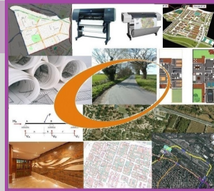
REDACCIÓN DE PROYECTOS DE URBANISMO

PLANEAMIENTO, URBANIZACIÓN, DESLINDES, PAISAJISMO